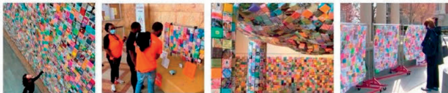
MICHIGAN Restaurante atrio

Comience con dos hojas de papel, cuando doble una Soul Box para reconocer una vida. Se puede armar en instalaciones de arte grandes y pequeñas, desde museos y ayuntamientos hasta iglesias, escuelas y escaparates. El movimiento continúa con un cambio cultural, a medida que las personas comprenden la devastadora pérdida de vidas por disparos y trabajan para mitigar esta crisis de salud nacional.