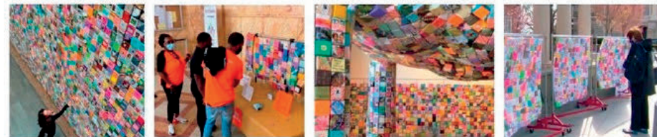
MICHIGAN Restaurante atrio

Comience con dos hojas de papel, cuando doble una Soul Box para reconocer una vida. Se puede armar en instalaciones de arte grandes y pequeñas, desde museos y ayuntamientos hasta iglesias, escuelas y escaparates. El movimiento continúa con un cambio cultural, a medida que las personas comprenden la devastadora pérdida de vidas por disparos y trabajan para mitigar esta crisis de salud nacional.